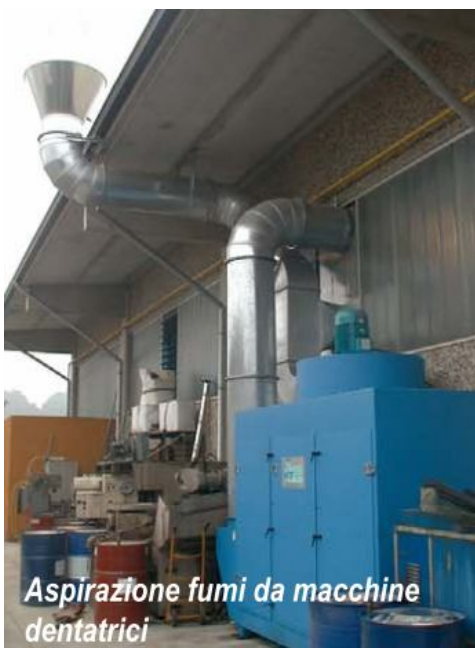
Aspirazione fumi da macchine dentatrici