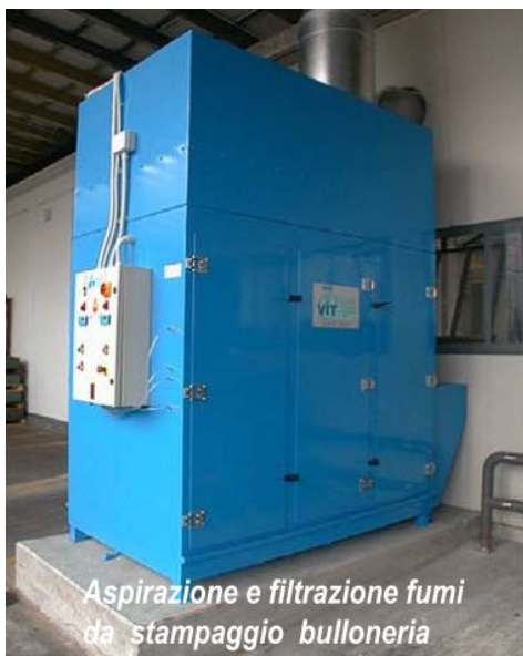
Aspirazione e filtrazione fumi da stampaggio bulloneria

Aspirazione e filtrazione di fumi, vapori e nebbie oleose